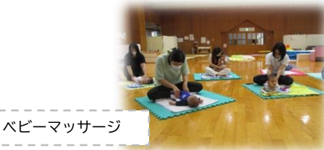
ベビーマッサージ