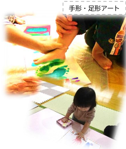
手形・足形アート