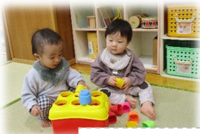
いっしょにあそぼう！